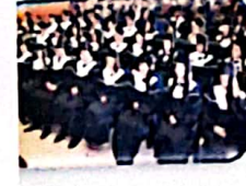
Formando Líderes de Calidad en Educación del Idioma Inglés